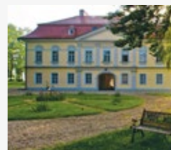
Seminar Schloss Bogenhofen