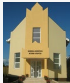
Biserica Adventistă din Beiuș